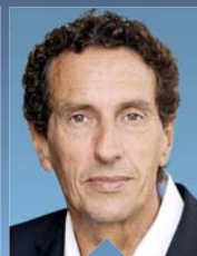
Prof. Dr. Julian Nida-Rümelin Professor für Philosophie, Staatsminister a.D.

27. April 2016 Pre-Workshop „Finanzierung von Unternehmensfortführungen in der Krise“